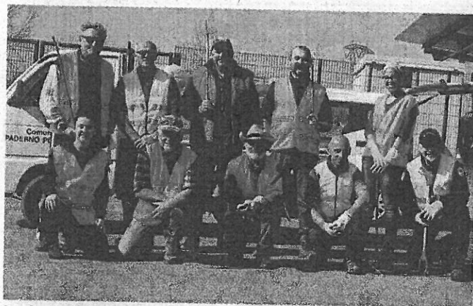
I volontari che hanno partecipato alla giornata del verde pulito

san Gervasio e strada Regina. Con pazienza, impegno e dedizione i cittadini hanno così raccolto rifiuti per 20 sacchi, con l'immondizia recuperata che è poi stata conferita nel centro di raccolta del paese. In vista della buona riuscita dell'iniziativa i partecipanti si sono attrezzati con guanti, gilet catarifrangenti e pinze, quest'ultime fornite dal Gruppo Verde Annico. E con spirito di collaborazione hanno portato a termine una passeggiata ecologica apprezzata. L'iniziativa verrà ripropo-